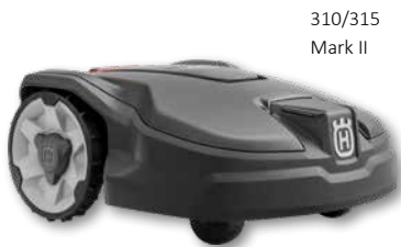
310/315 Mark II